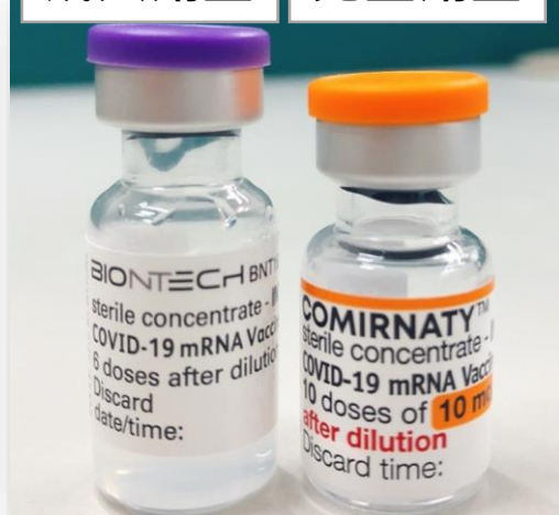
成人劑型 兒童劑型